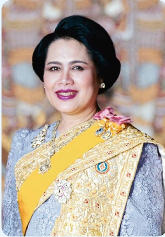
คือมีขวัญใจไทยทั้งผอง พระเกียรติก็เกริกไกรแม่ไพศาล พระกรณียกิจเรื่องเรื่องตระการ ทุกถิ่นย่านขึ้นจ้าน้ำพระทัย

วันที่ 5 พฤษภาคม 2562 พระบาทสมเด็จพระเจ้าอยู่หัว มีพระบรมราชโองการเฉลิมพระนามาภิไธย สมเด็จพระนางเจ้าสิริกิติ์ พระบรมราชินีนาถ พระบรมราชชนนีพันปีหลวง